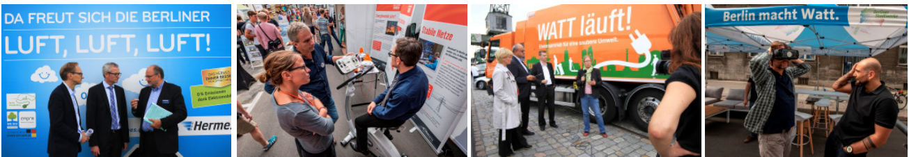
Fotos: MET 2015 (im Westhafen) und MET 2017 / 2018 (Rathaus Tiergarten) / Fotos: Theo Heimann

und weitere: Theodor-Heuss-Gesamtschule / Projekt „Grüne Lunge“ / Ottospielplatz / MINT-Werkstatt für Elektronik und Informatik (MINT-Impuls e.V.) / Horizontereignis gUG, Projekt Müllernte / Zentrum für Kunst und Urbanistik Moabit (ZK/U)